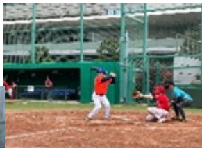
少年野球 ソフトボール 地域活動